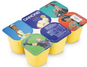
599-DANONE KIDS POLPA BANANA/MAÇA 510GR 162815