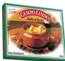
FONDUE UHT CAMPO LIMPO POLENGHI 400GR 162527