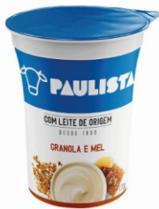
358-BEB LAC PAULISTA GRANOLA E MEL 170G 17023