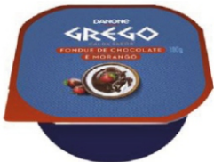
501-DANONE GREGO 100G FONDUE MOR/CHOC 17088