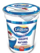
135-IOGURTE NATURAL UNIBABY 170G 162035