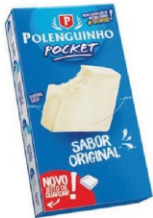
POLENGUINHO POCKET ORIGINAL DPI6X34G 162178