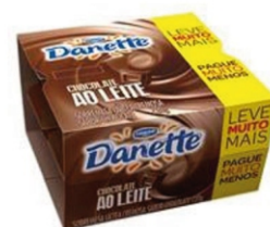
237-DANETTE AO LEITE/ BCO MULTIPACK 1080G 161944