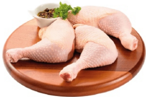
COXA E SOBRECOXA KG