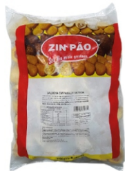
SALSICHA EMPANADA PQ.20G ZIN PÃO PCT 2KG