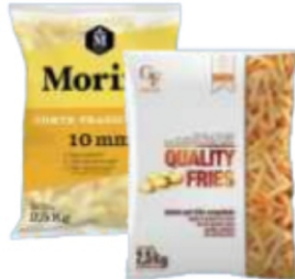
BATATA PRÉ FRITA