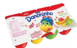
778 - DANONINHO PETIT SUISE MULTI 320G 17291