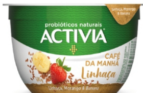
411-ACTIVIA CAFE MANHÃ LINHAÇA/MOR 170G 161631