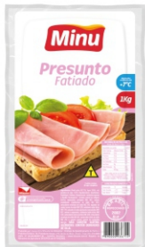
PRESUNTO FAT 1KG CX 4KG MINUANO(859) 16834