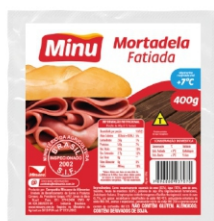
MORTADELA MINUANO C/G 400G C/ 10 UN 716