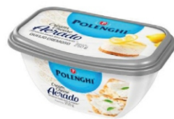
CREAM CHEESE AERADO POLENGHI 250GR 162428