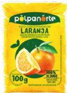
POLPA NORTE LARANJA 100G PCT10UN