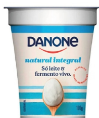
816-DANONE NATURAL INTEGRAL 160G 162290