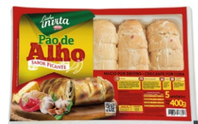
PAO DE ALHO PICANTE RESF.INVITA 400G