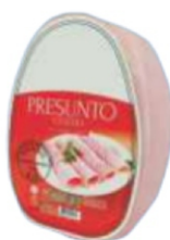
PRESUNTO PEÇA INTEIRA/ FATIADO