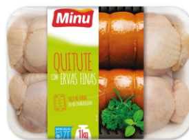
QUITUTE C/ ERVAS FINAS BJA 01KG CX 4KG 17181