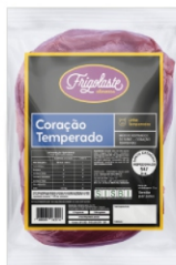
CORAÇÃO SUINO TEMP. VACUO RESF FRIGOL