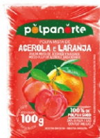
POLPA NORTE ACEROLA/ LARANJA 100GR