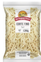
BATATA PRE FRITA 7MM MCCAIN 8X2,25KG 162191