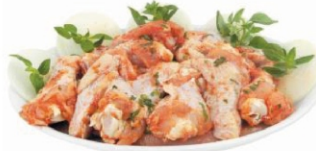
COXINHA DA ASA TEMPERADA BDJ/IQF/PCT