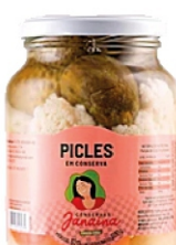
PICLES EM CONSERVA JANAINA 300G 162844