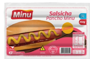
SALSICHA PANCHO MINU 12UN X350G CX4,2K 18554