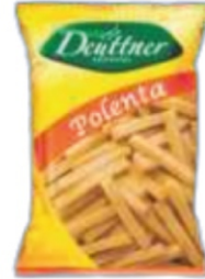
POLENTE PRÉ FRITA