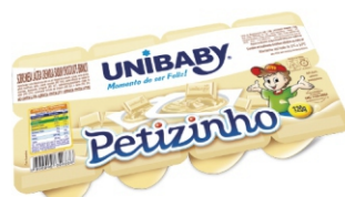
5500-SOBREMESA CHOC BC PETIT UNIBABY 320G 162802