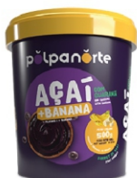
ACAÍ MIX POTE 500G- BANANA POLPA NORTE