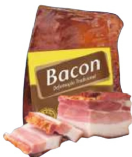
BACON MANTA - PEDAÇOS