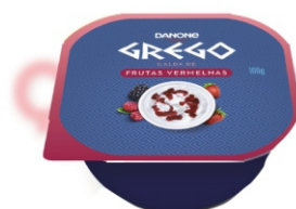
201-DANONE GREGO 100G FRUT VERM 17047