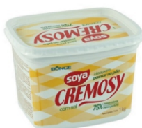
MARGARINA CREMOSY 50%C/S SOYA 1KG CX12UN 162824