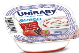
3577-IOG.GREGO FRUTA VERMELHA UNIBAB 90G 162155