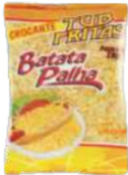
BATATA PALHA 1KG