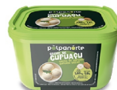
CUPUACU CREME-POTE 1,7 LTS (CX 06) POLP