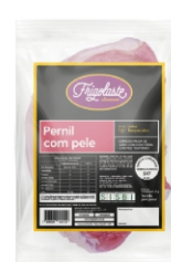
PERNIL SUINO C/OSSO C/PELE INT.CONG FRIG