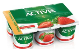
954 - ACTIVIA MORANGO LTE FERM 600GX8 18312