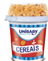
153-BEB LACT BAUNILHA/ CEREAIS UNIBA 130G 162018