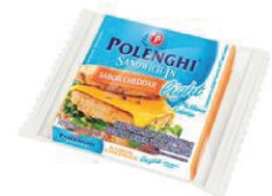
SANDWICH-IN Z/LACTOSE POLENGHI 8FAT.144G 162186