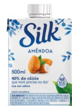
249- SILK AMENDOA 500ML CX12UN 18951