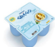
43-DANONE GREGO LIGHT MARACUJA 360G 162129