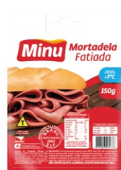
MORTADELA FAT. MINU C/G 150GR CX C/ 20UN 1074