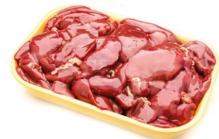
FÍGADO DE FRANGO BDJ/PCT