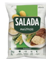
MAIONESE SALADA REG BAG 3K BUNGE 162950