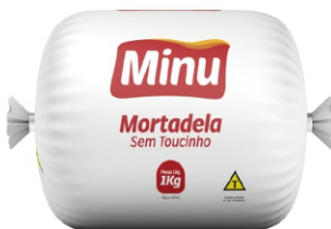
MORTADELA BOLINHA 1KG S/G MINU 5KG-1003 17511