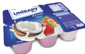
59- BEB LACT BDJ MOR/COCO 510G UNIBABY 18690