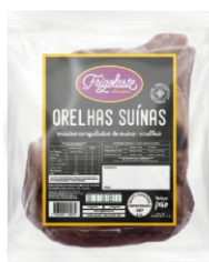
MUIDOS CONG.SUINO ORELHA EMB. FRIGOLASTE