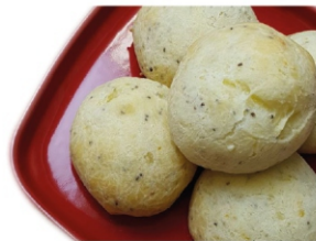
PÃO DE QUEIJO/BATATA DOCE ZINPÃO PCT400G