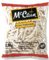
BATATA PRE FRITA CG TRAD.MCCAIN 6X2,5KG 162190