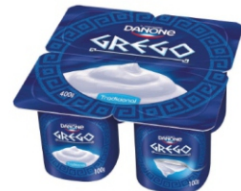
836-DANONE GREGO ORIGINAL 400 CX 12 16983