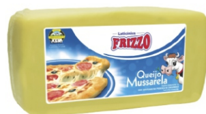
QUEIJO MUSSARELA FAT. FRIZZO + - 2,200KG 23