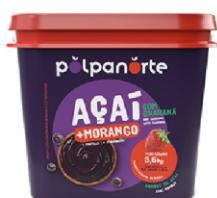
ACAÍ MIX BALDE 3,6KG-MORANGO