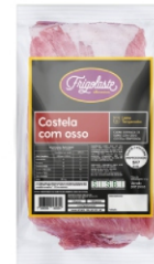
COSTELA SUINA S/PELE/CAR/TIRAS CG FRIGOL