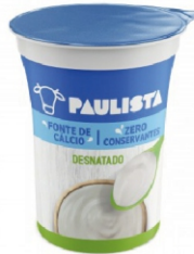
347-PAULISTA NATURAL DESNATADO 150G 162516