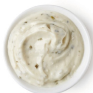
MAIONESE MOLHO PICLES BS 400G INVITA