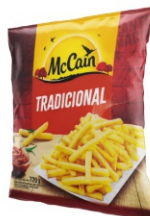
BATATA PRE FRITA CG. TRAD.MCCAIN 12X720G