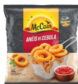
ANEIS DE CEBOLA BRAZIL MCCAIN 18X400G