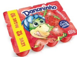
780-DANONINHO PETIT SUISSE MORANGO 320G/480G 17284 / 17283