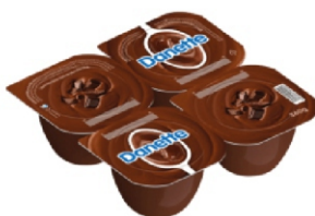
108-DANETTE CHOC. SOB LACTEA 360G CX12 16972