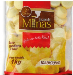
PÃO DE QUEIJO TRAD FAZENDA MINAS1KG