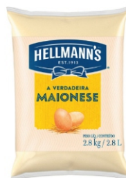
MAIONESE HELLMANN'S ORIGINAL SACO 2,8KG