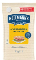
MAIONESE HELLMANN'S ORIGINAL DOYPACK 1,0KG