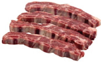
COSTELA EM TIRAS