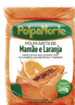
POLPA NORTE MAMAO/LARANJA 100 GR.CX10UN