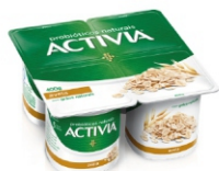
775-ACTIVIA AVEIA LEITE FERM P 400G CX12 16954