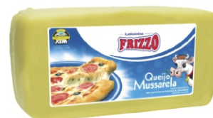
QUEIJO MUSSARELA INTEIRO FRIZZO PC+ - 2,5K 27