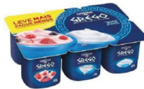
797-DANONE GREGO ORIG/ FRUTAS VERME. 600G 17287