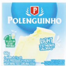
POLENGUINHO QUATRO QUEIJOS 68GR 162418