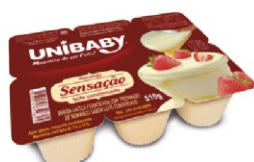
60-BEB LACT BDJ SENSAÇÃO LEITE/COND 510G 162013