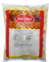
BOLINHO DE CREME/MILHO 20G ZINPÃO PCT2KG