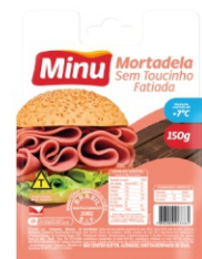
MORTADELA FAT.MINU S/G 150G C/20UN(4338) 1075