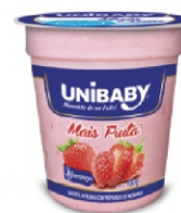
144-IOG. PT MAIS FRUTA MORANGO UNIB 500/100G 162034 / 162031