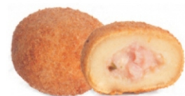
RISOLES PRES/QUEIJO 120G ZINPÃO PCT1,2KG