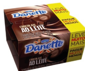
32-DANETTE CHOCOLATE 720G 2 PACK SOBR 16975