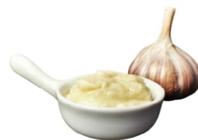
PASTA DE ALHO BISNAGA 400G INVITA