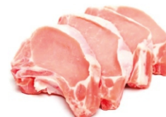
CARRE SUINO CONG PCT+2KG FRIGOLASTE