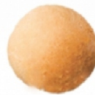
PAO QUEIJO TRAD.25G ZIN PÃO PCT1KG