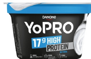
697- YOPRO POLPA 160G NATURAL 18712