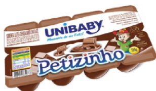
64-SOBREMESA CHOC PETIT UNIBABY 320G 162051