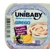
2347-IOG.GREGO FRUTA AÇAÍ/BAN UNIBAB 90G 162265