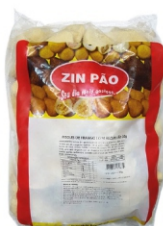
RISOLES FRANGO/REQ.30GR ZIN PAO PCT 2KG