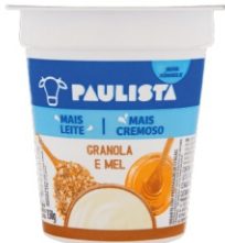
348-PAULISTA NATURAL GRANOLA 150G 162518