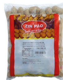
CROQUETE CARNE/REQ.20G ZIN PÃO PCT 2KG