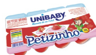
62-PETIT SUISE MORANGO UNIBABY 320G 162049