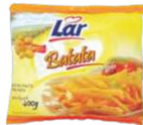
BATATA PRÉ FRITA - 400G