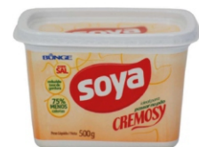
MARGARINA SOYA 250G/500G/1KG