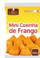
COXINHA DE FRANGO 22G ZIN PÃO PCT 2KG