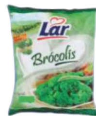
BRÓCOLIS LAR 350G