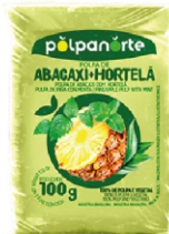
POLPA NORTE ABACAXI/ HORTELA 100GR PCI0UN