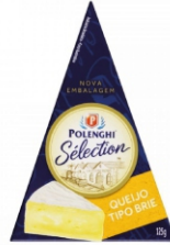
QUEIJO BRIE SELECTION POLENGHI+-125G 162161