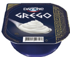
202-DANONE GREGO 100G TRADICIONAL 17048