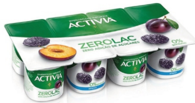
422-ACTIVIA 0% MOR E AME LTE FERM 600GX8 17678