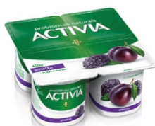
614-ACTIVIA AMEIXA LEITE FERM 400G CX 12 16953