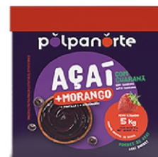
ACAÍ MIX MORANGO POLPA NORTE CX5KG