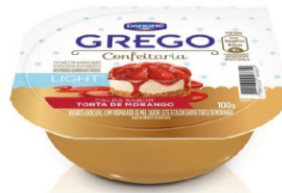
628-DANONE GREGO 100G LIGHT TORTA/MORANG 17882