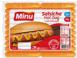
SALSICHA HOTDOG C/URUCUM 3KG CONG.MINU 18139