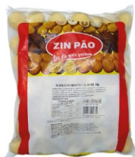
RISOLES QUATRO QUEIJOS 20G ZIN PÃO PC2KG