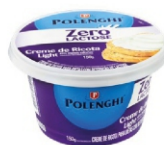
CREME DE RICOTA ZERO/LACT POLENGHI 150GR 162256