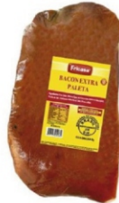
BACON DEF. EXTRA PALETA FRICASA +- 3KG 19904