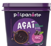
ACAÍ MIX BALDE 3,6 KG-TRADICIONAL .