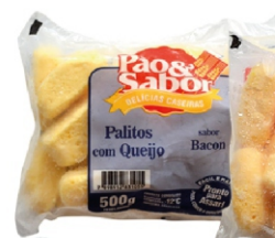
PALITO C/QUEIJO(BACON) 500G PAO&SABOR 162870