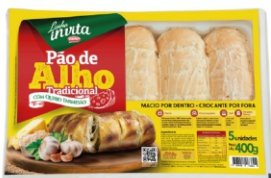
PÃO DE ALHO TRAD. RESF.INVITA 400G