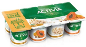
423- ACTIVIA MAMAO CER E AVEIA LF 600GX8 17675