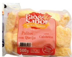
PALITO C/QUEIJO(BACON) 500G PAO&SABOR 162871