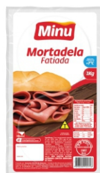
3715-MORTADELA FAT C/G.MINUA.CX4KG 4X1KG 16835