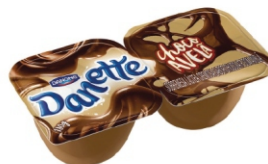
621-DANETTE CHOC AVELA 180G 17891