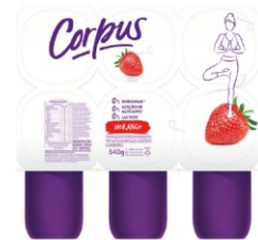
123- CORPUS POPLA MORANGO 540GR 162326