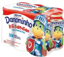
603-LEITE FERMENTADO DANONE 450G 161699