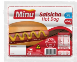
SALSICHA HOT DOG MINU S/COR 400G (6655) 15713