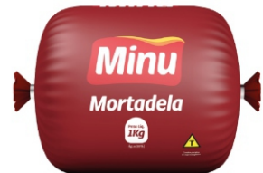
MORTADELA BOLINHA 1KG C/G MINU CX5KG-1002 17510