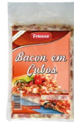
BACON EM CUBOS FRICASA 1KG (5130) 1491