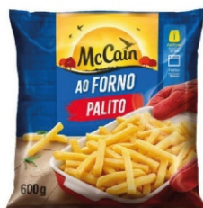
BATATA AO FORNO TRAD.MCCAIN 16X600G