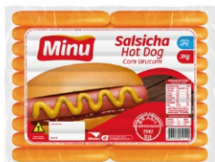
3593-SALS RESF.HOT DOG C/C 3KG MINU 16454