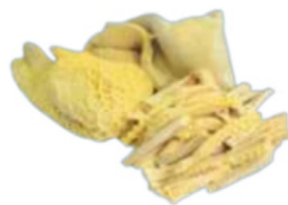
ESTOMAGO PRÉ COZIDO PICADO