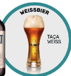
KIT 1GF WEISSBIER + TACA BIG JONH