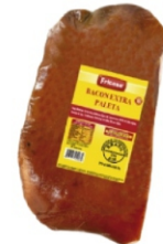
BACON DEFUMADO MANTA FRICASA +-3KG(5248) 17298