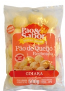
PÃO DE QUEIJO C/GOIABADA 500G PAO&SABOR 162874