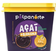
ACAÍ MIX BALDE 3,6KG-BANANA