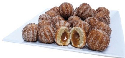
MINI CHURROS DOCE DE LEITE ZIN PÃO 2KG