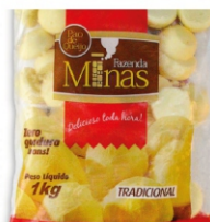
PAO QUEIJO BIG FAZENDA MINAS PCT 1KG