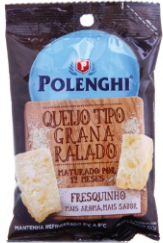
QUEIJO RALADO GRANA SELECT.POLENGHI 100G 162470