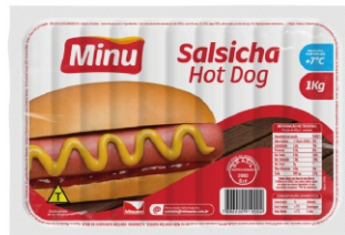
SALSICHA HOTDOG 1KG CX18KG MINU S/C 17490