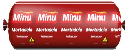
MORTADELA MINU 3KG C/G CX C/18KG(4498) 718