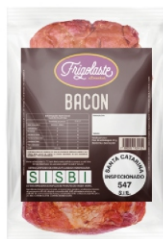
BACON MANTA DEF. INTEIRO VACUO FRIGOLASTE