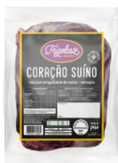
MIUDOS CG.SUINO RIM TEMP/RECH FRIGOLASTE