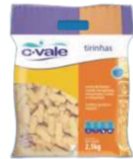
FILÉZINHO DE PEITO EMPANADO EM TIRAS PCT/IQF