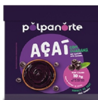
ACAÍ MIX CAIXA 10 KG- TRADICIONAL.