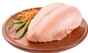
PEITO DE FRANGO COM OSSO