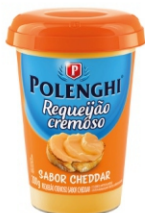
REQUEIJAO CHEDDAR POLENGHI 200GR 162180