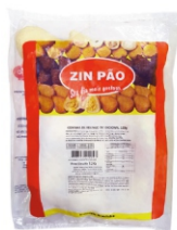
COXINHA DE FRANGO 150GR ZIN PÃO PCT1,5KG