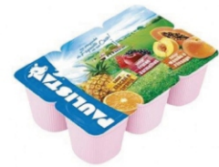
514-BEB LAC POL PAULISTA FESTI/FRUT 360G 18395