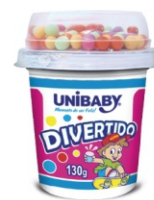
113-BEB DIVER FLC/ ARROZ/COLOR UNIBAB130G 162012