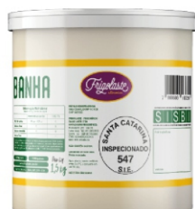
BANHA FRIGOLASTE BLD 1,5KG CX12UN