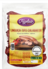
LING.TIPO CALABRESA +-2KG RESF.FRIGOLATE