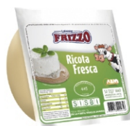
RICOTA FRIZZO 28