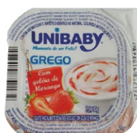
3579-IOG.GREGO MORANGO UNIBABY 90G 162157