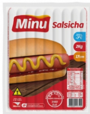
4309-SALSICHA 17CM S/C MINU 2KG 8UN CX16 18728