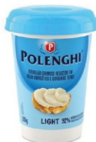
REQUEIJAO LIGHT POLENGHI 200GR 162182