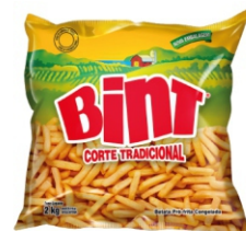
BATATA PRE FRITA CONG BINT MCCAIN 2KG 162108