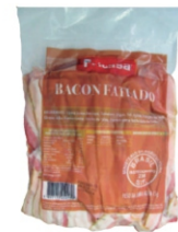
BACON FATIADO 1KG FRICASA(5140) 17601