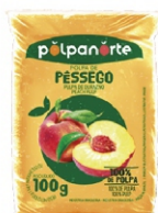
POLPA NORTE PESSEGO 100 GR. PCT10UN