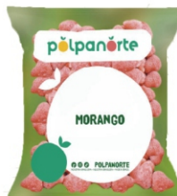
FRUTA MORANGO GRANEL 1,02KG POLPA NORTE