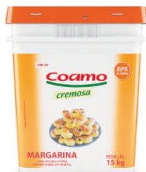
MARGARINA BALDE SEM SAL