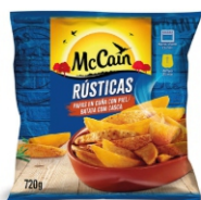
BATATA PRE FT CG. RUSTICAS MCCAIN 12X720G