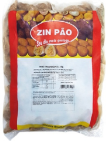
KIBE TRADICIONAL 20G ZIN PÃO PCT 2KG