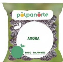
FRUTA AMORA GRANEL 1,02KG POLPA NORTE