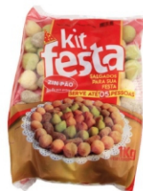
KIT FESTA ZIN PÃO 1KG