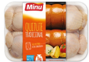
QUITUTE TRAD. BAND 1KG CX 4KG MINU(4318) 735