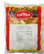
RISOLES CALABRESA/REQ.20G ZINPÃO PCT 2KG