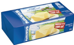
550-MANTEIGA PAULISTA COM SAL 200GCX25UN 18528