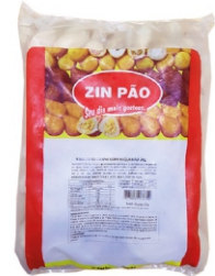
RISOLES CARNE/REQUEIJAO 30GR ZIN PÃO 2KG