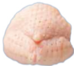
SAMBICA DE FRANGO BDJ/PCT