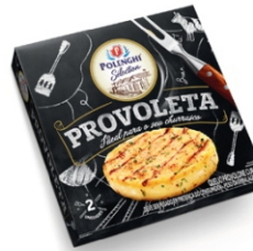
QUEIJO PROVOLETA SELECTIC POLENGHI+-280G 162469