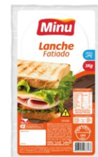
APRES LANCHE FAT. 1KG CX 4KG MINU (3473) 18607