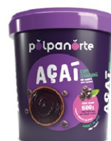
ACAÍ MIX POTE 500G- TRADICIONAL (CX 6 KG)