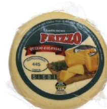
QUEIJO TIPO COLONIAL PEÇA C/ CAPA TRANSP 24