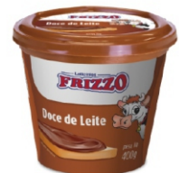
DOCE DE LEITE FRIZZO FD 12 UN X 400G 20