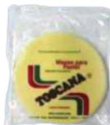
MASSA PASTEL 200G / 500G / 1KG