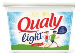
MARGARINA QUALY LIGHT 250G/500G