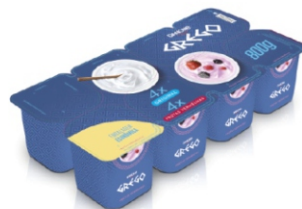
319 - DANONE GREGO 800G ORIGINAL/FRUTAS 18516