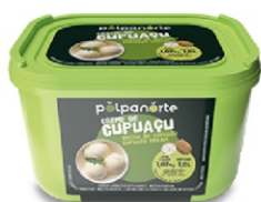
CUPUACU CREME-POTE 1,02KG POLPA NORTE