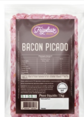
BACON PICADO PCT 1KG FRIGOLASTE