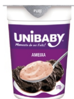
6071-IOG PARCIAL DESN AMEIXA UNIBABY170G 162881