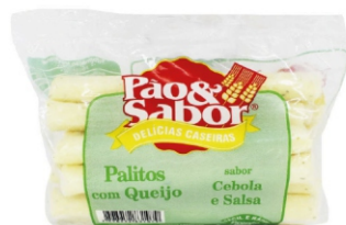
PALITO C/QJO(CEBOLA/SALSA) 500G PAO&SABOR 162869