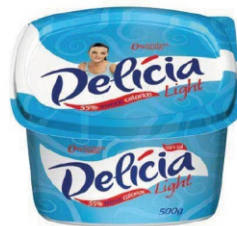
MARGARINA DELÍCIA LIGHT 250G/500G