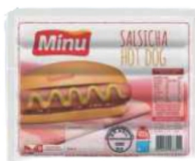
SALSICHA HOT DOG 400G/1KG/5KG