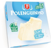
POLENGUINHO LIGHT 68GR 162176