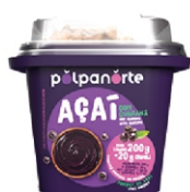
ACAÍ MIX TRAD.C/GRANOLA-POTE 220G POLPA