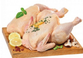
FRANGO COLONIAL INTEIRO