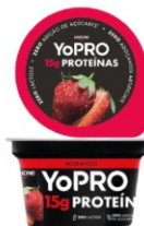
172 - YOPRO MORANGO 160G 18397