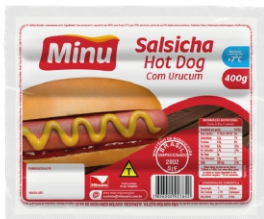
SALSICHA HOT DOG C/ URUCUM 400G CX 4,8KG 18194