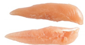
FILÉZINHO DE PEITO DE FRANGO BDJ/IQF/PCT