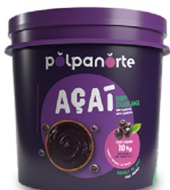
ACAÍ MIX BLD 12 KG- TRADICIONAL POLPA NOR