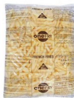
BATATA ONE FRY 9/9 MCCAIN 6X2,5KG 162192