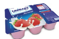
56-BEB LACT BDJ MORANGO UNIBABY 510G 162016