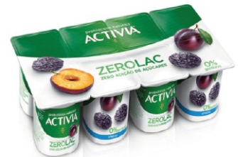
135 - ACTIVIA 0% POLPA AMEIXA 800G 18991