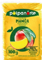
POLPA NORTE MANGA 100GR PCT 10UN