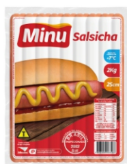
3216-SALSICHA 25CM MINU 2KG 162330