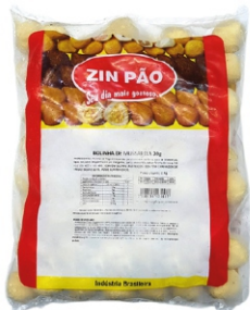
BOLINHA DE QUEIJO MUSSARELA ZIN PÃO 2KG