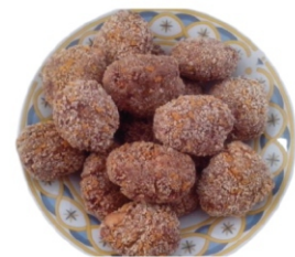
BOLINHO DE CARNE 100G ZIN PÃO PCT1KG