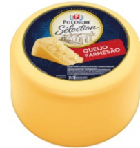
GRANA SELECTION PARMESAO POLENGHI +-200G 162258