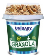
152-BEB LACT BAUNILHA/ GRANOLA UNIBA 130G 162019