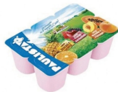
362-BEB.LAC POLPA PAULISTA FEST FRU 510G 17012