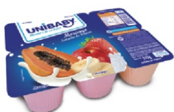
55-BEB LACT BDJ MGO/SALADA UNIBABY 510G 162017