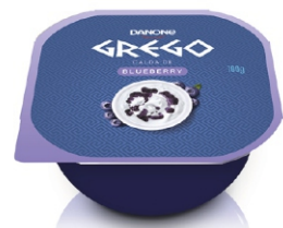
475-DANONE GREGO 100G BLUEBERRY 18481