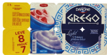
317-DANONE GREGO 800G LIGHT ORIG/MOR 16986