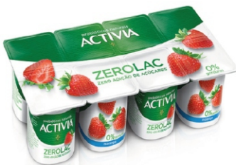
346 - ACTIVIA 0% POLPA MORANGO 800G 18992