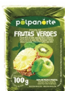
POLPA NORTE FRUTAS VERDES .100GR CX10UN