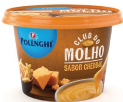
CLUB DO MOLHO CHEDDAR POLENGHI 220GR 162165