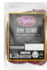
MIUDOS CONG. SUINO RIM EMB. FRIGOLASTE