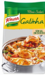
CALDO DE GALINHA KNORR 1KG