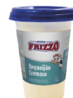
REQUEIJAO POTE 180G FRIZZO 162107