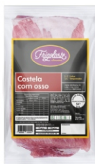
COSTELA SUINA S/P S/ CARRE CG INT.FRIGOL