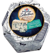
GORGONZOLA SELECTION POLENGHI 140G 162257