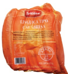
LING.CALABRESA(5039) DEF. 2,5KG FRICASA 16314