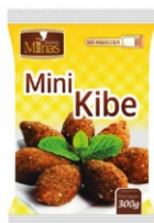
MINI KIBE TRAD.PRE FRITO FAZ. MINAS 300G