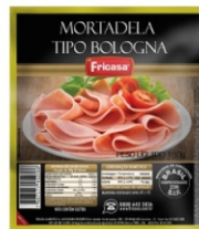
MORTADELA BOLOGNA FAT.180G FRICASA(5236) 18126