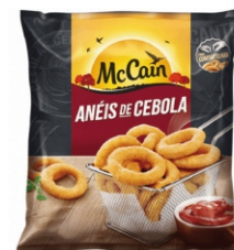
ANEIS DE CEBOLA EMPANADO MCCAIN 10X1,05K