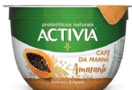
783-ACTIVIA CAFE/MANHÃ AMARANTO/MA 170G 161634