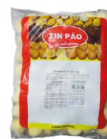
MINI COXINHA FRANGO PRE FRITA FAZ. MINAS