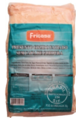
PRESUNTO COZ. RET.FAT (5043) PÇ 3KG FRICA 16911