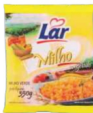
MILHO LAR 350G