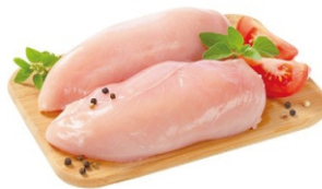
FILÉ DE PEITO DE FRANGO BDJ/IQF/PCT