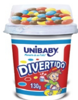
141-BEB DIVER PAST/CONFEI/ CHOC UNIBA130G 18670