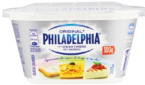
048 - PHILADELPHIA POTE ORIGINAL 300G 18999