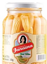
MINI MILHO EM CONSERVA JANAINA 300G 162843