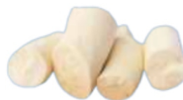
RAIZ MANDIOCA CONGELADA 1KG