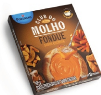
CLUB MOLHO FONDU/CHEDDAR 400G POLENGHI 162504