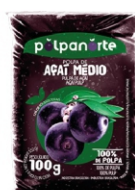
ACAÍ POLPA NORTE 100 GR. PCTIKG