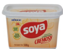
MARGARINA CREMOSY 50% C/S SOYA 12X500GR 162836