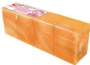
QUEIJO FAT PROC.CHEDDAR POLENGHI 2,735KG 162319