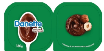
712- DANETTE CREME DE AVELÃ 180G 162817