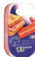
APRESUNTADO PEÇA INTEIRA/ FATIADO