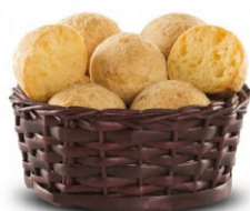
PAO DE QUEIJO BISNAGA 400G INVITA