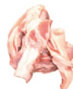
RETALHO SUINO CG.CABEÇA MAGRO FRIGOLASTE