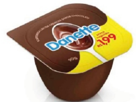
608-DANETTE CHOCO UNIT 90G 161852