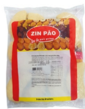
RISOLES DE FRANGO MEIA LUA 150G ZIN PÃO