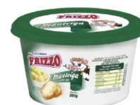
MANTEIGA POTE 200G FRIZZO 18149