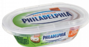
047 -PHILADELPHIA POTE ZERO LACTOSE 150G 161609