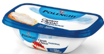
CREAM CHEESE TRADICIONAL POLENGHI 150GR 162168