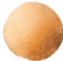
PÃO DE QUEIJO BIG 100G ZIN PÃO PCT 1KG