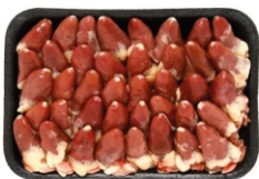
CORAÇÃO DE FRANGO BDJ/PCT