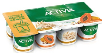
557-ACTIVIA MAMAO CER/ AVEIA LF 800G CX6 16960