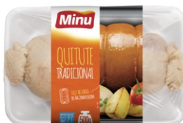
QUITUTE CONG.INDIV.500GR MINUANO CX 8KG 18608