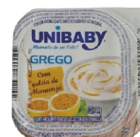
3578-IOGURTE GREGO MARACUJA UNIBABY 90G 162156