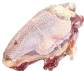
DORSO DE FRANGO BDJ/PCT