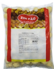
RISOLES DE FRANGO 20GR ZIN PÃO PCT 2KG