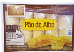
PÃO DE ALHO TRAD.SEM REFR. INVITA 310G