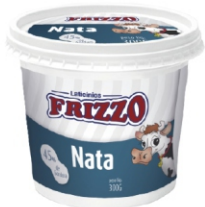
NATA POTE FRIZZO 300GR 6