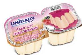
67-FLAN FRUTAS VERMELHAS UNIBABY 180G 162054