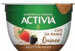
087-ACTIVIA CAFE/MANHÃ QUINOA/FV 170G 161633