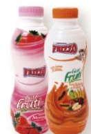
BEBIDA LACTEA SALADA DE FRUTAS FRIZZO 560