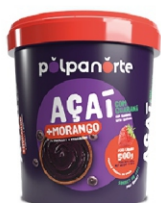
ACAÍ MIX POTE 500G- MORANGO (CX 6 KG)