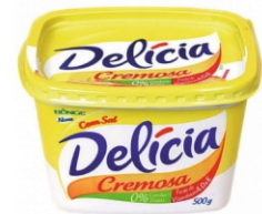
MARGARINA DELÍCIA C/ E SEM SAL 250G/500G