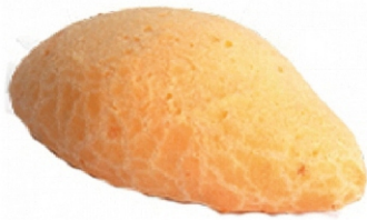
BISCOITO 3 QUEIJOS 25G ZIN PÃO PCT1KG