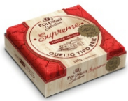
QUEIJO BRIE SUPREME SELEC.POLENGHI 140G 162546