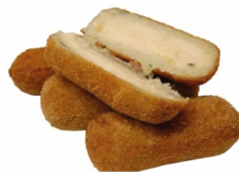
CROQUETE FGO/REQ.CHEDDAR 100G ZINPÃO 1KG