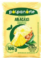
POLPA NORTE ABACAXI 100G PCT10UN