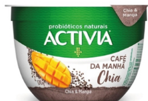
088-ACTIVIA CAFE/ MANHÃ CHIA/MANGA 170G 161632