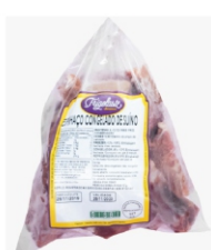
ESPINHACO SUINO CG. FRIGOLASTE CX-+22KG