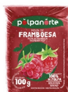
POLPA NORTE FRAMBOESA 100 GR.PCT10UN