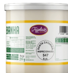
BANHA FRIGOLASTE BLD 850G