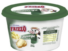
MANTEIGA 1 QUALIDADE C/SAL 200G FRIZZO 162528