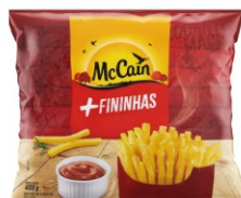
BATATA CORTE FINO MCCAIN 20X400GR