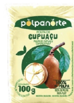
CUPUAÇU POLPA NORTE 100GR PCT 10UN