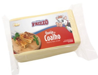
QUEIJO DE COALHO PC+ - 2,200KG FRIZZO 162233