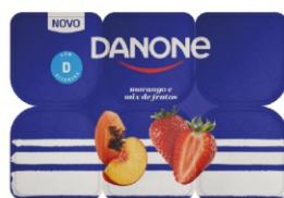
795-DANONE POLPA MIX FRUTA 510GR 162811