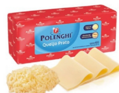
QUEIJO PRATO FORMA POLENGHI IMP.+/-3,5KG 162370