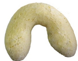
CHIPA ZIN PAO PCT1KG