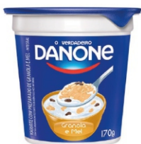
175-IOGURTE DANONE GRANOLA E MEL 170GX20 17733