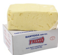
MANTEIGA FRIZZO CX C/ 5KG 631