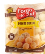
PÃO DE QUEIJO FORNO DO SUL 30G PCTIKG 162877