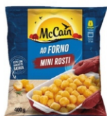
BATATA MINI ROSTI MCCAIN 28X400G 161868