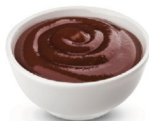
MOLHO BARBECUE BISNAGA 400G INVITA