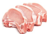
CARRE MATRIZ CONG. FRIGOLASTE