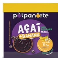
ACAÍ MIX BANANA POLPA NORTE CX5KG