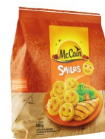
BATATA SMILES RETAIL BRAZIL MCCAIN18X500