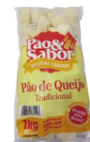
PÃO DE QUEIJO TRAD 15G PCTIKG PAO&SABOR 162863