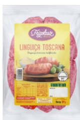
LING. TOSCANA 700 GR FRIGOLASTE RESF