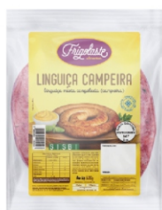
LING.MISTA(CAMPEIRA) CG.700GR FRIGOLASTE