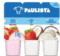
363-BEB.LAC.PAUL.COC/ MOR BAN510G(10UN) 17010