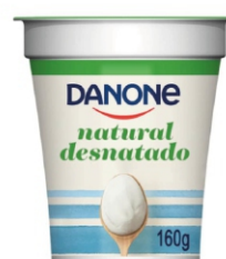
813-DANONE NATURAL DESNATADO 160G 162307