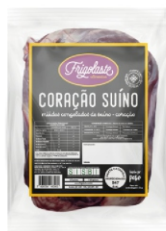
CORACAO SUINO SACO CONG ECOFRIGO +- 22KG