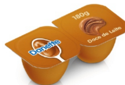
472-DANETTE DOCE DE LEITE 180GR 162003