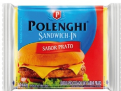
SANDWICH-IN PRATO POLENGHI LIGHT 8FAT144G 162434