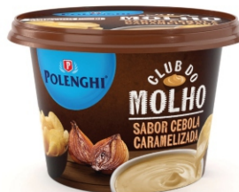
CLUB DO MOLHO CEBOLA/ CARM.POLENGHI 220G 162163