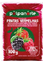
POLPA NORTE FRUTAS VERMELHAS 100GR PCT10U