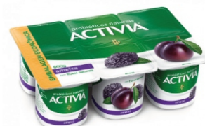
955 - ACTIVIA AMEIXA LTE FERM 600GX8 18311