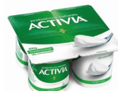
612-ACTIVIA ORIG. LTE FER MEL 400G CX12 16951