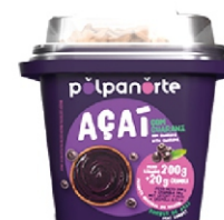
ACAÍ MIX POLPA NORTE 200 GR.10UN.