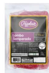
LOMBO SUINO TEMPERADO VACUO CONG FRIGOLA