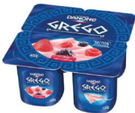
837-DANONE GREGO FRUTA/ VERMEL 400G CX12 16984