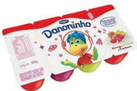
389-DANONINHO ML MOR/FRAMB/UVA 320GPETIT 17667