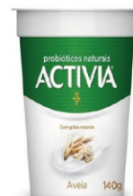
421- ACTIVA POLPA AVEIA 140G 162520