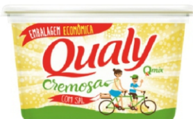
MARGARINA QUALY LIGHT 250G/500G