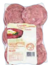
CALABRESA FATIADO 1KG