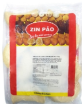
RISOLES CARNE/REQ.120G ZIN PÃO PCT1,2KG