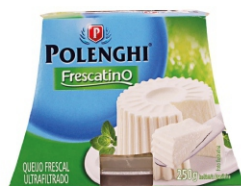
FRESCATINO TRADICIONAL POLENGHI 250GR 162174