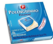
POLENGUINHO TRADICIONAL 68GR 162179