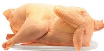
GALINHA CAIPIRA INTEIRA