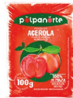
POLPA NORTE ACEROLA 100GR PCT10UN