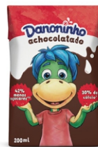
DANONINHO ACHOCOLATADO 200ML CX27UN 162099