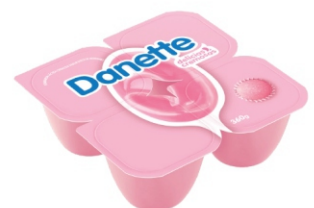
732- DANETTE DOCINHO DE MORANGO 360G 162839