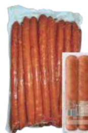
CALABRESA PCT 2,5KG - 2 A 2