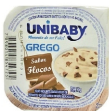
3580-IOGURTE GREGO FLOCOS UNIBABY 90G 162197