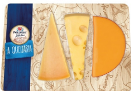
TABUA DE FRIOS SELECTION POLENGHI +-230G 162443