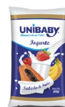
120-IOG.PCT SALADA DE FRUTA UNIBABY 850G 162040