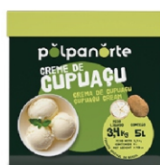
CUPUACU CREME CAIXA 5 LITROS 3,4 KG .