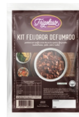
KIT FEIJOADA DEF.RESF.FRIGOLASTE +-500G