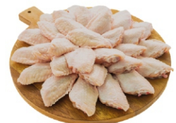
MEIO DA ASA BDJ/IQF/PCT