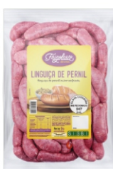
LINGUIÇINHA PERNIL 700G CONG FRIGOLASTE