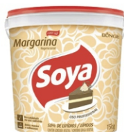
MARGARINA SOYA 50% BD 15 KG BUNGE 162951