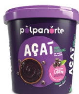
ACAÍ MIX POTE 1,02KG- TRADICIONAL POLPA N