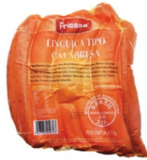
LING.CALABRESA COZ.FAT. FRICASA 2KG(5129) 161643