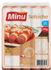
SALSICHA MINUANO 250G CX 15UND (3730) 16446