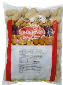
CROQUETE CALABRESA/REQ.20G ZINPÃO PCT2KG