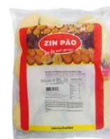
RISOLES FRANGO/REQ.120G ZIN PÃO PCT1,2KG