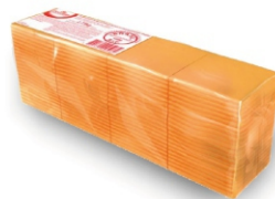
QUEIJO FAT.PROC.PRATO POLENGHI 2,735KG 161899