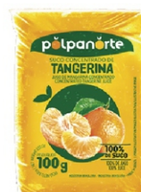
POLPA NORTE TANGERINA POLPA 100 GR.10UN