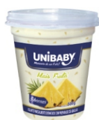
6002-IOG.PT MAIS FRUT ABACAXI UNIB 500G 162879