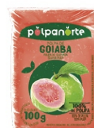
POLPA NORTE GOIABA 100GR PCT10UN