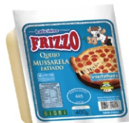
QUEIJO MUSSARELA FAT INTER. 150G / 400G 15681 / 18434