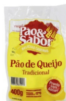
PÃO DE QUEIJO TRAD PCT400G PAO&SABOR 162866