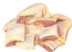
GALINHA CAIPIRA PICADO