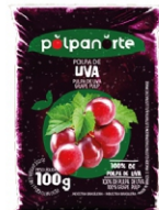
POLPA NORTE UVA 100GR PCT 10UN