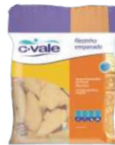
FILÉ DE PEITO EMPANADO PCT/IQF - 1KG