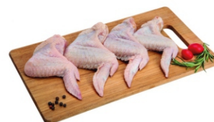
ASA DE GALINHA INDIVIDUAL CX 15-18