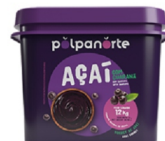
ACAÍ MIX BALDE TRAD.12KG POLPA NORTE