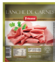
PRESUNTADA LANCHE FAT. FRICASA 500GR-5168 16310