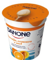
367-DANONE NATURAL LARANJA/CENOU MEL 160G 162459