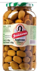
AZEITONA EM CONSERVA JANAINA 480G 162852