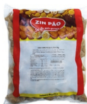
KIBE COM REQUEIJÃO 20G ZIN PÃO PCT 2KG