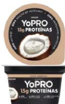
54 - YOPRO COCO CREMOSO 160G 18400