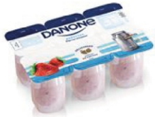
827-DANONE IOGURTE ED ESPECIAL MORANGO 510GR 162963