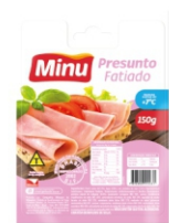
PRESUNTO FAT. 150GR MINU CX C/20 UN(842) 886