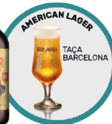
KIT 1GF AMERICAN LAGER+ TACA BIG JONH