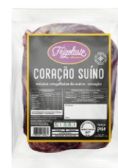
CORACAO SUINO CONG +- 12KG