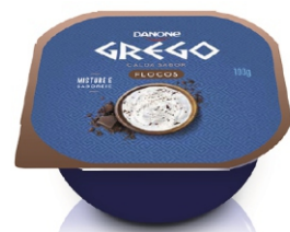
477-DANONE GREGO 100G FLOCOS 18483