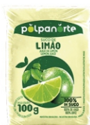
POLPA NORTE LIMAO 100 GR.10UN.