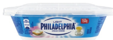
128 - PHILADELPHIA POTE LIGHT 150G 19192