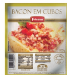
BACON EM CUBOS PCT 200G FRICASA (5221) 17772