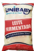
5240-LEITE FERMENTADO PCT UNIBABY800G 162391