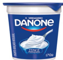
537-IOGURTE DANONE NATURAL 170G CX 20 17022