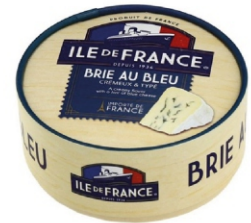
BRIE AU BLEU ILE DE FRANCE POLENGHI 125G 162242