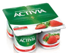
613-ACTIVIA MORANGO LEITE FERM 400G CX12 16952