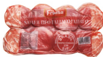
SALAME ITALIANO FAT.1KG FRICASA (5163) 17899