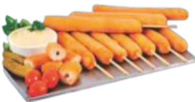
ESPETINHO EMPANADO - 100G