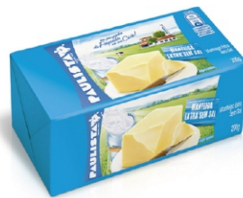
MANTEIGA PAULISTA SEM SAL 200G CX 25 UN 18527