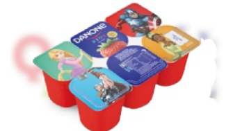
598-DANONE KIDS POLPA MORANGO 510GR 162814