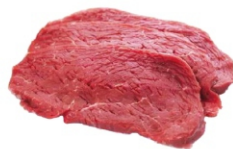
CARNE PARA BIFE VAZIO