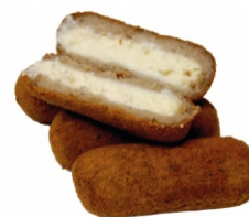
CROQUETE CARNE/REQ.100G ZIN PÃO PCT1KG