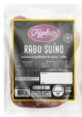
MIUDOS CONG.SUINO RABO EMB.FRIGOLASTE