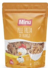
924-PELE FRITA FRANGO 18UN X200G CX3,6KG 16465