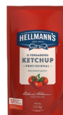
KETCHUP HELLMANN'S SACO 1KG