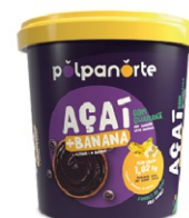
ACAÍ MIX POTE 1,02KG- BANANA POLPA NORTE