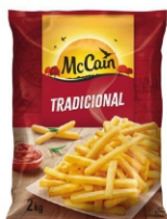
BATATA PRE FRITA CG.TRAD.MCCAIN 5X2KG