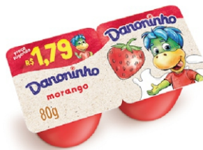
448-DANONINHO MORAN 80G QJ PETTIT SUISE 17061