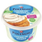
CREME DE RICOTA LIGHT POLENGHI 150GR 162260