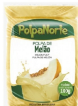
POLPA NORTE MELAO 100G PCT10UN