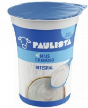
348-PAULISTA NATURAL LCM 150G 162517