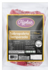
SOBREPALETA SUINA TEMP VACUO CONG FRIGOL