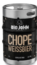
CHOP BIG JOHN WEISSBIER BARRIL 30LT