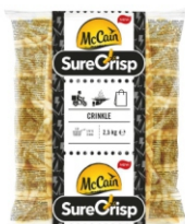
BATATA SURECRISP 9/9 MCCAIN 5X2,5KG 162193