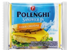
SANDWICH-IN CHEDDAR LIGHT POLENGHI 144G 162261