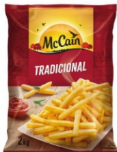
BATATA PRE FRITA CG TRAD.MCCAIN 8X2KG 162268