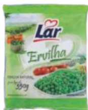
ERVILHA LAR 350G