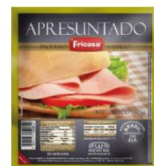
APRESUNTADO FAT.180GR FRICASA (5081) 161746