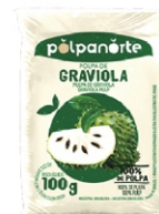
POLPA NORTE GRAVIOLA 100 GR.10UN.