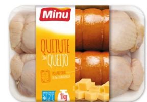
QUITUTE C/QUEIJO CONG. BDJA 1 KG CX 4 KG 16778