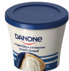
471-REQUEIJAO CREMOSO DANONE REGULAR200G 17036