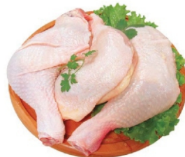
COXA E SOBRECOXA DORSAL KG