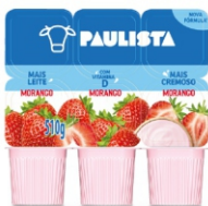
361-BEB LAC POLPA PAULISTA MOR BAND 510G 17013