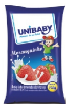
BEB LACT PCT MORANGO UNIBABY 850/170G 162028 / 162027