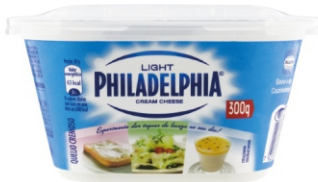
118 - PHILADELPHIA POTE LIGHT 300G 19190