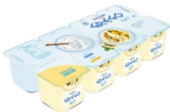
440-DANONE GREGO LIGHT ORIG/MARACUJA800G 161668