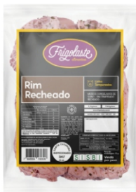
RIM SUINO RECHEADO CONG FRIGOLASTE