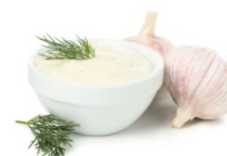
MAIONESE MOLHO TARTARO BS 400G INVITA