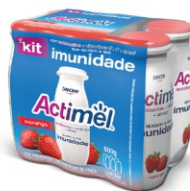
030-ACTIMEL LTE FERMENT MORANGO 600GR 16933