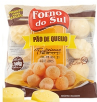
PÃO DE QUEIJO FORNO DO SUL 30G PCT300G 162876