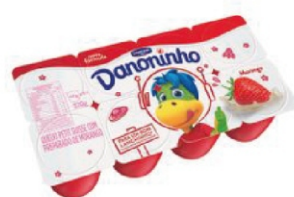
149625-DANONINHO MOR. 320G QJ PETIT SUISE 161811