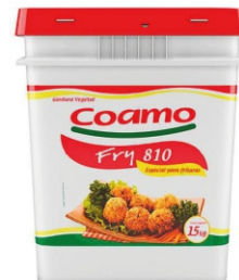
GORDURA VEGETAL BALDE E CX