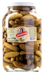
PEPINO EM CONSERVA JANAINA 1800G 162887