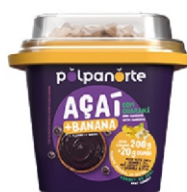
ACAÍ MIX BANANA C/GRANOLA-POTE 220G