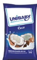
116-IOGURTE PCT COCO UNIBABY 850G 162037