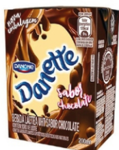
449-LEITE AROMAT. DANETTE 200ML CX27UN 18347