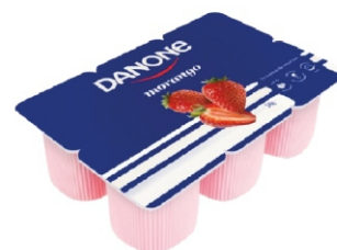
796-DANONE POLPA MORANGO 510GR 162810