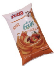
BEBIDA LACTEA PESSEGO FRIZZO 161629