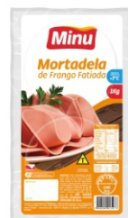
2507-MORTADELA FRAN. FAT 1KG MINU 162329