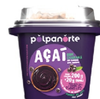
ACAÍ MIX TRAD.POTE 200G POLPA NORTE