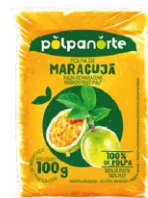
POLPA NORTE MARACUJÁ 100 GR 10UN