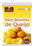
MINI BOLINHA QUEIJO PREFRITO 300G ZINPÃO