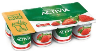
77-ACTIVIA MORANGO LTE FERM 800G CX 6 16957