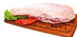
DIANTEIRO MATRIZ DESOSSADO CG FRIGOLASTE