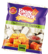
DADINHOS DE TAPIOCA PCT500G PAO&SABOR 162878