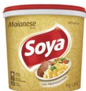
MAIONESE SOYA REG BD 3KG BUNGE 162958