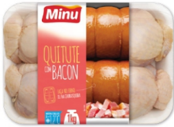
QUITUTE C/BACON BANDEJA 1KG MINU (5021) 16554