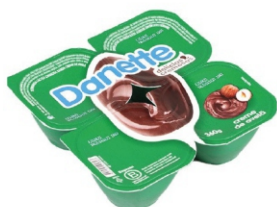
716- DANETTE CREME DE AVELÃ 360G 162816