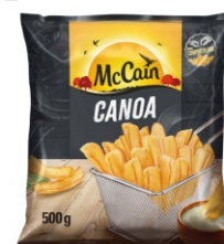
BATATA CANOA MCCAIN 18X500G