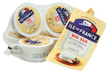
QUEIJO MINI BRIE ILE FRANCE POLENGH 125G 162246