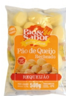
PÃO DE QUEIJO C/REQUEIJÃO 500G PAO&SABOR 162875