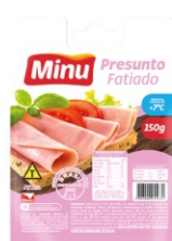
APRESUNTADO FAT MINU 150G C/ 20 UN (840) 733