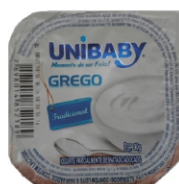
3581-IOG.GREGO TRADICIONAL UNIBABY 90G 162158