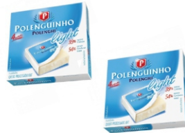
POLENGUINHO POCKET LIGHT DPI6X34G 162177