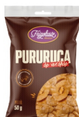
TORRESMO PURURUCA 50G FRIGOLASTE