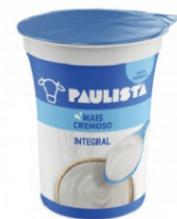
343-PAULISTA NATURAL INTEGRAL 150G 162515