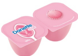
731-DANETTE DOCINHO DE MORANGO 180GR 162812