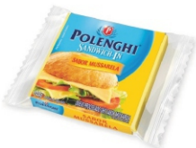
SANDWICH-IN MUSSARELA POLENGHI 8FATIA144G 162185