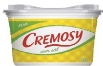
MARGARINA CREMOSY 50%C/S SOYA 24UNX250GR 162859