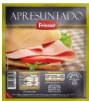
PRESUNTO COZ.FAT.180GR FRICASA(5112) 161747