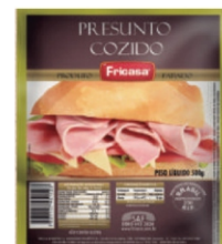
PRESUNTO COZIDO FAT. FRICASA(5171)500GR 16311