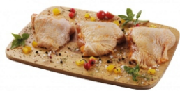
SOBRECOXA TEMPERADA BDJ/IQF/PCT