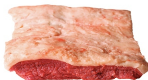
CAPA DO FILÉ