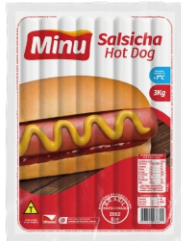
SALSICHA HOT DOG MINU S/C 3KG CX18 KG 15714