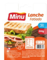
LANCHE FATIADO 150G 20UN CX 3KG(3431) 18803