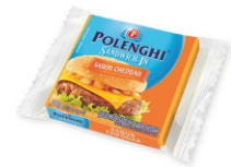
SANDWICH-IN CHEDDAR POLENGHI 8 FATIA144G 162184