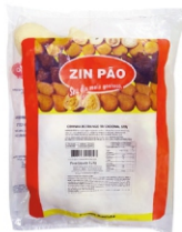
COXINHA FRANGO TRAD.120G ZINPÃO PC1,2KG