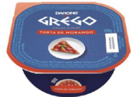
431-DANONE GREGO TORTA/ MORANGO 100G 161664