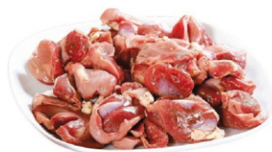
MOELA DE FRANGO BDJ/PCT