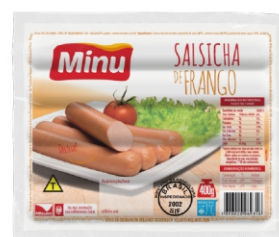
SALSICHA DE FRANGO MINU 400G CX12UN-6931 16445