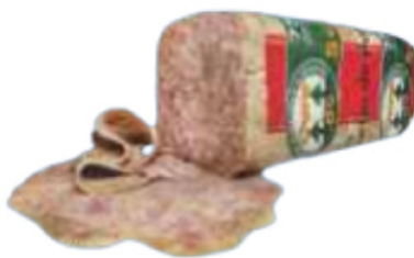
QUEIJO DE PORCO 1KG