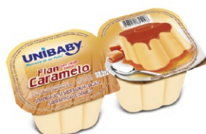
65-FLAN BAUNILHA UNIBABY 180G 162083