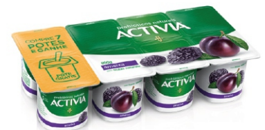
78-ACTIVIA AMEIXA LTE FERM 800G CX 6 16958