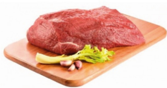
COXÃO MOLE / COXÃO DURO