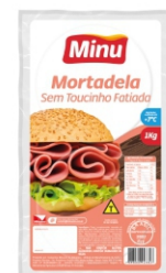
MORTADELA S/G FAT MINU. CX 4KG 4UN X1KG 16836