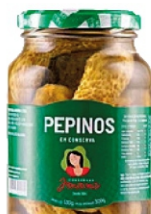
PEPINO EM CONSERVA JANAINA 300G 162841