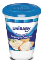
MIST MEGA CREMOSA REQUEIJAO UNIBABY 180G 162048