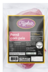
PERNIL DESOSSADO CONG.FRIGOLASTE