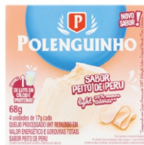
POLENGUINHO PEITO DE PERU LIGHT 68GR 162393