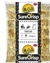
BATATA SURECRISP 6/6 MCCAIN 4UNX2,5KG 162562