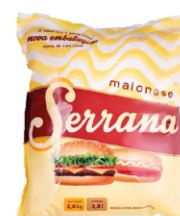
MAIONESE SERRANA JANAINA PCT2,8 KG 162883