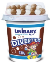
140-BEB DIVER FLC/ ARROZ/CHOC PB UNIB130G 162011