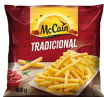
BATATA PRE FRITA CG.TRAD.MCCAIN 20X400G