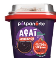
ACAÍ MIX MORANGO C/GRANOLA-POTE 220G