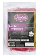
LING.LOMBO S. C/QUEIJO CONG.600GR FRIGOL