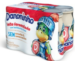
404 - DANONINHO LEITE FERMENTADO 450G 18354