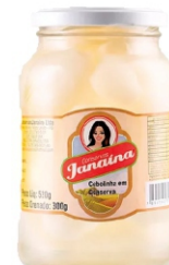
CEBOLA BRANCA EM CONSERVA JANAINA 300G 162842