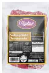
PALETA SUINAC/OSSO C/PELE INT.CG FRIGOL