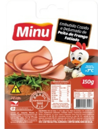
3723-PEITO FRANGO DEF FAT150GX20UN CX3KG 16837