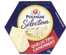
QUEIJO CAMEMBERT SELECTION POLENGHI 125G 162162