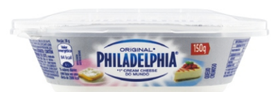
163 - PHILADELPHIA POTE ORIGINAL 150G 19191