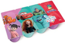
952-DHO PETIT TUTTI FRUTTI ALG.DOCE 320G 162214