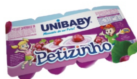
5400-PETIT SUISE UVA UNIBABY 320G 162803