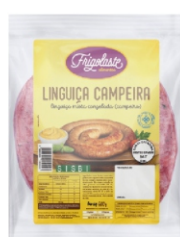
LING.MISTA(CAMPEIRA) CG.600GR FRIGOLASTE