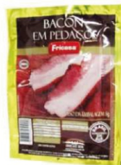
BACON TABLET PEDACOS CX3KG FRICASA(5270) 17771