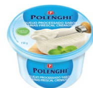
CREME DE MINAS FRESCAL POLENGHI 150GR 162247