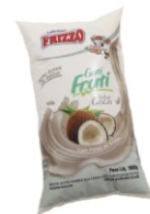
BEBIDA LACTEA COCO FRIZZO 558