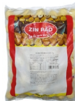
RISOLES DE REQUEIJÃO 20G ZIN PÃO PCT 2KG