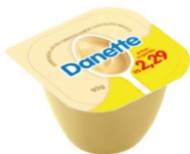
569-DANETTE CHOCO BRANCO UNIT 90G 162559