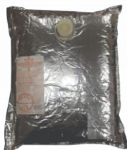
BEBIDA LACTEA UHT BAUNILHA 5L POLENGHI 162198