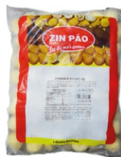
COXINHA FRANGO C/BATATA 22G ZINPÃO PT2KG