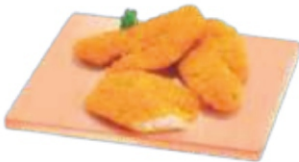
EMPANADO DE FRANGO CAIXA 30/60 UN - 100G