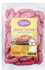
LING. TOSCANA 5KG CONG. FRIGOLATES CX10K