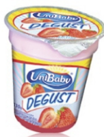
IOGURTE DEGUST C/GELEIA DE MORANGO 130G 162030