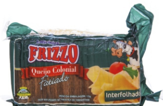
QUEIJO COLONIAL FAT. FRIZZO + - 2,5KG 18519