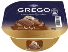
977-DANONE GREGO 100G CHOC BELGA/ COCO 18172