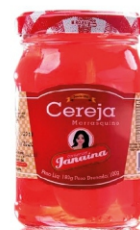
CEREJA MARRASQUINO JANAINA 100G 162847