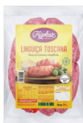
LINGUIÇINHA TOSCANA CONG FRIGOLASTE 700G