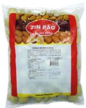
COXINHA DE BROCOLIS 22G ZIN PÃO PCT 2KG