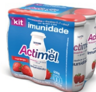
615-ACTIMEL LTE FERM PROMO P5L6 CX 6 16924