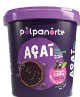
ACAÍ MIX TRADICIONAL 1,2KG POLPA NORTE