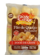
PÃO DE QUEIJO C/DOCE DE LEITE 500G PAO&SABOR 162873