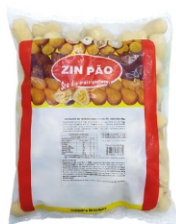
CROQUETE FG/REQ.CHEDDAR 20G ZINPÃO PC2KG