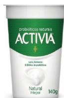
413- ACTIVA POLPA INTEGRAL 140G 162519