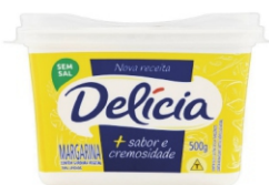
MARGARINA DELICIA C/SAL E S/SAL 500GR CX12UN 815 / 162826