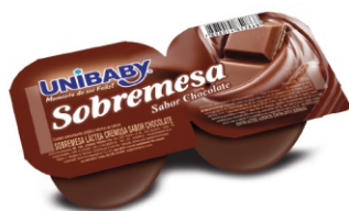
66-SOBREMESA CHOCOLATE UNIBABY 180G 162050