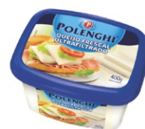
QUEIJO FRESCAL TRAD. POLENGHI 400GR 162259