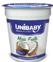
142-IOG PT MAIS FRUTA COCO UNIBABY 500/100G 162032 / 162033