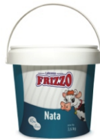
NATA BALDE FRIZZO 3,6 KG 7