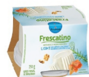
FRESCATINO LIGHT POLENGHI 250GR 162173