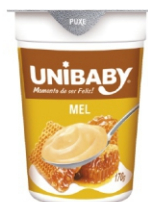
6073-IOG PARCIAL DESN MEL UNIBABY170G 162882