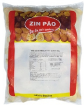
RISOLES PRESUNTO/QUEIJO 30GR ZIN PÃO 2KG