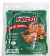
QUEIJO COLONIAL MEIA LUA FRIZZO 17988