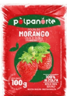
POLPA NORTE MORANGO 100GR PCT 10UN