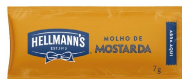
MOSTARDA HELLMANN'S SACHÊ 7G