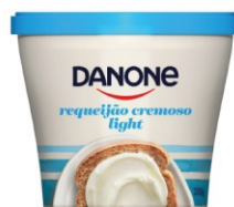
920- REQUEIJAO LIGHT DANONE 200G 18652