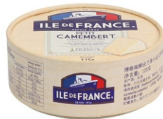
CAMEMBERT ILE DE FRANCE POLENGHI 125G 162243