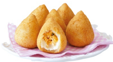
COXINHA FRANGO CONG PRE FRITA 100G INVIT