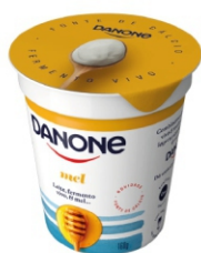
36- DANONE NATURAL MEL 160G 162436