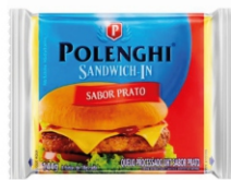
SANDWICH-IN PRATO POLENGHI 8 FAT.144G 162187