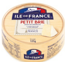
QUEIJO BRIE ILE DE FRANCE POLENGHI 125G 162244