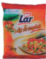
MIX LAR 350G