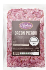
BACON DEF. PICADO S/PELE PCT 2KG FRIGOL