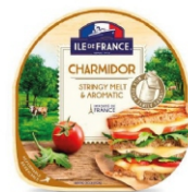
QJ FT ILE DE FRANCE CHARMIDOR POLENGI50G 162245