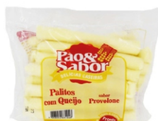
PALITO C/QUEIJO(PROVOLONE) 500G PAO&SABOR 162872