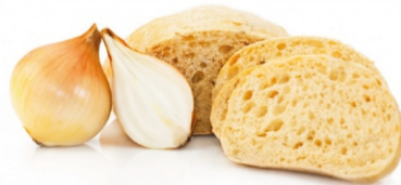
PAO DE CEBOLA 130GR INVITA