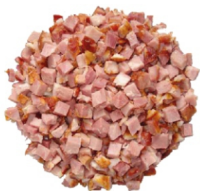
BACON SATIARE EM CUBOS