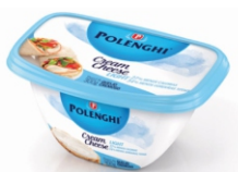
CREAM CHEESE LIGHT POLENGHI 300GR 162167