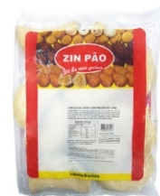
RISOLES DE CARNE MEIA LUA 120G ZIN PÃO