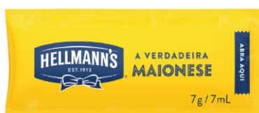
MAIONESE HELLMANN'S ORIGINAL SACHÊ 7G