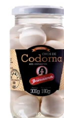
OVO DE CODORNA EM CONSERVA JANAINA 300G 162845