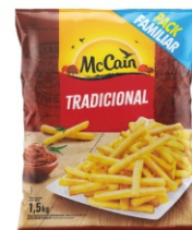
BATATA CG PRE FRITA TRAD MCCAIN 10X1,5KG