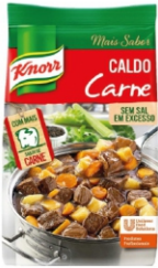
CALDO DE CARNE KNORR 1KG