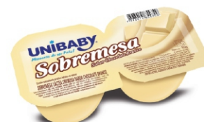
627-SOBREMESA CHOC BRANCO UNIBABY 180G 162052