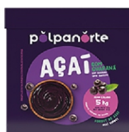
ACAÍ MIX-TRADICIONAL POLPA NORTE CX 5KG