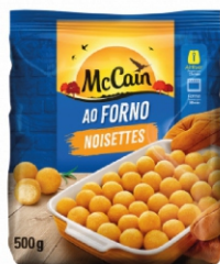
BATATA NOISSETES BRAZIL MAICCAN 18X500G