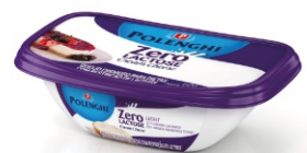
CREAM CHEESE ZERO LACTOSE POLENGHI 150GR 162171