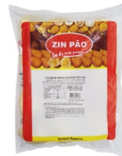
COXINHA FRANGO/REQ.120G ZIN PÃO PCT1,2KG