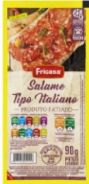
SALAME ITALIANO FAT 90GR FRICASA- 5111 161751