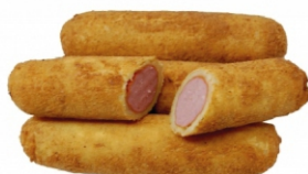
SALSICHA EMPANADA ZIN PÃO PCT 1,2KG